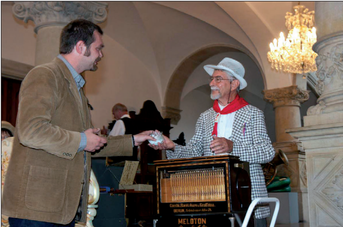
Další ročník festivalu Liberecký flašinetář probíhal jak uvnitř budovy Severočeského muzea...