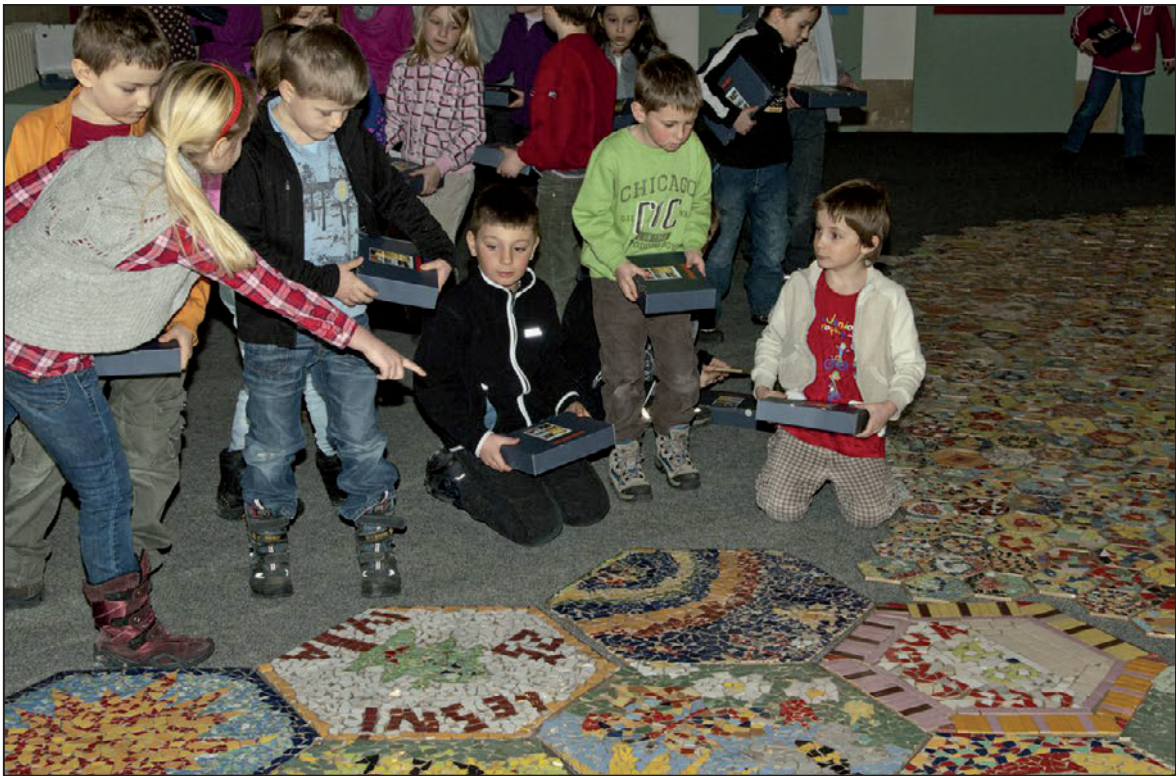
Výstava Loukamosaic – doprovodné výtvarné dílny pro děti (únor 2012)