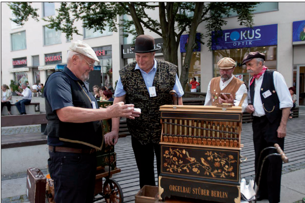
...tak i v ulicích města Liberce (srpen 2012)