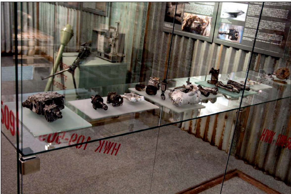
Exponáty na výstavě Industriál války (červen 2012)