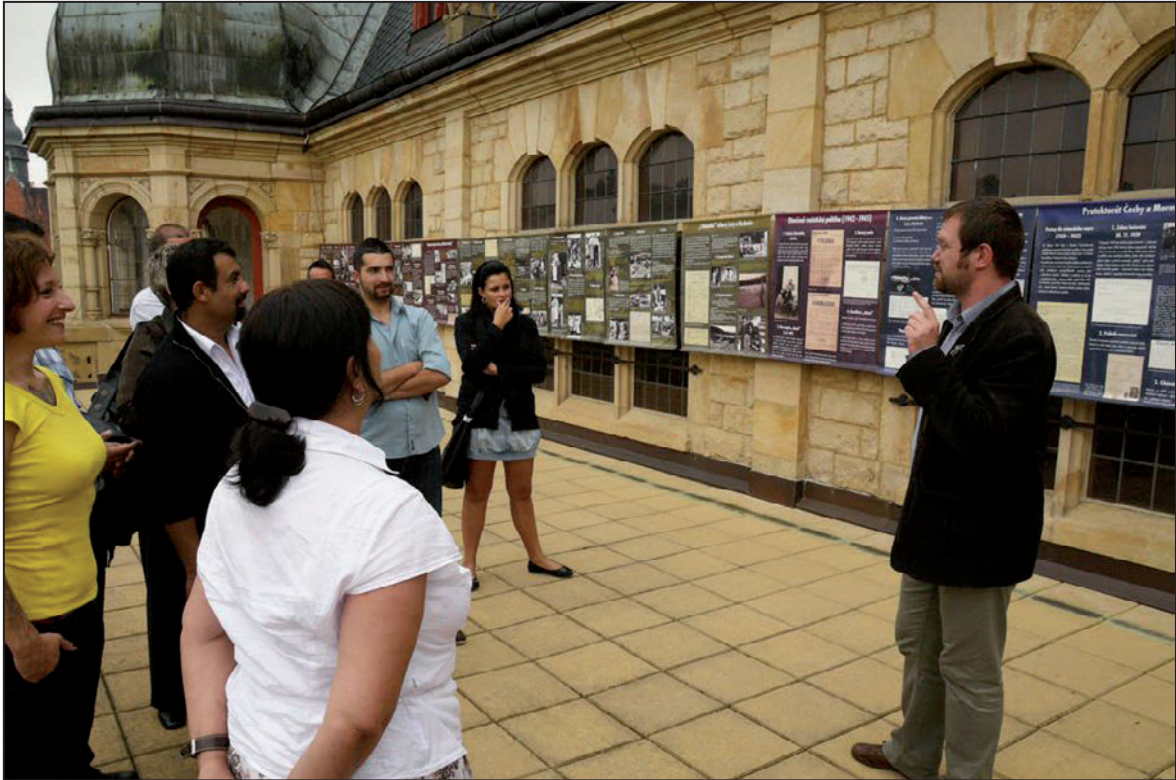
Genocida Romů v době druhé světové války – panelová výstava na terase SM (červen 2012)