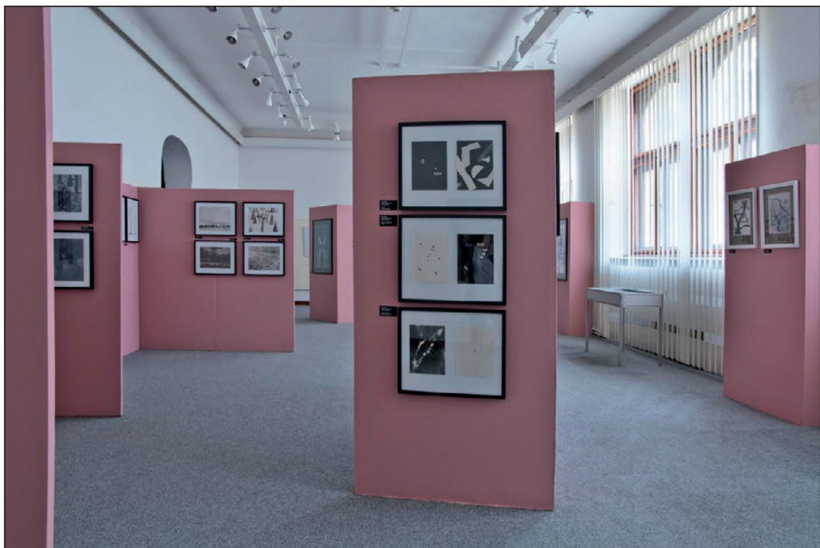
Z výstavy Studio výtvarné fotografie (duben 2012)