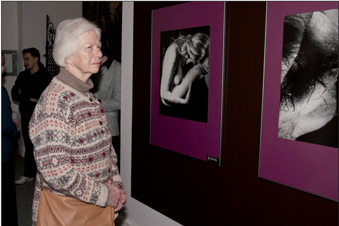
Slavnostní otevření expozice Kabinetu fotografie (březen 2012)