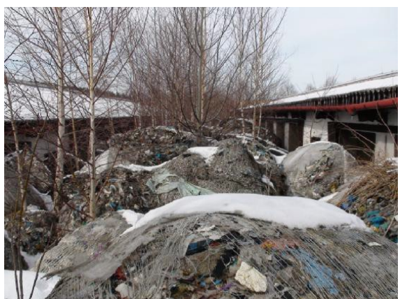
Foto č.3 - meziprostor B-C - původní stav