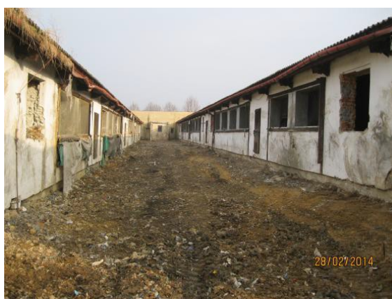
Foto č.6 - meziprostor C-D - vyčištěná plocha