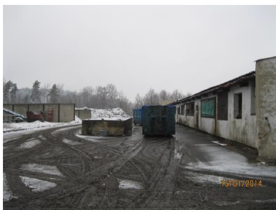
Foto č.2 - Sektor I - vyčištěný prostor