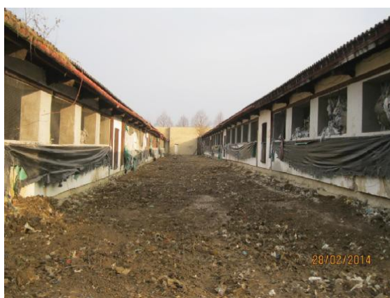
Foto č.4 - meziprostor B-C - vyčištěná plocha