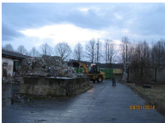
Foto č.1 - Sektor I - začátek odvozu