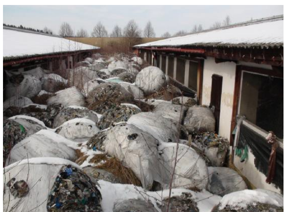
Foto č.5 - meziprostor C-D - původní stav