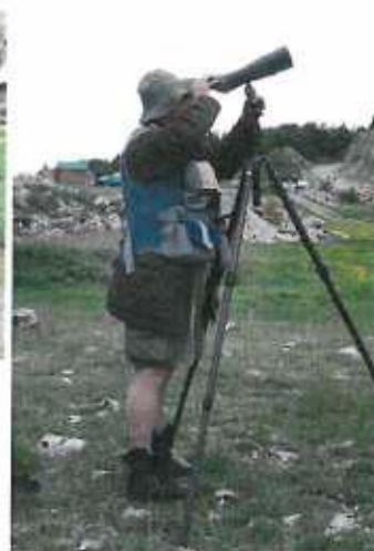
Terénní zoologický výzkum a průzkum v pohraničí Černé hory a Albánie.