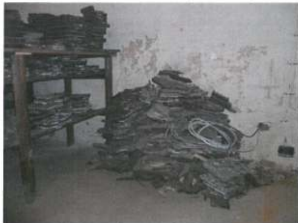
Stav textilních potiskovacích forem před stěhováním.